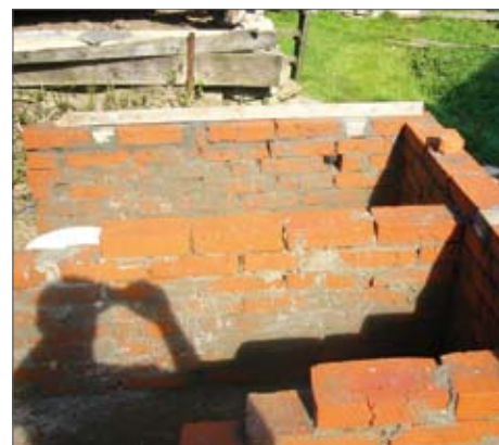
Фиг.4: Строеж на външните тухлени стени на фекалните камери (ляво), отвор за тръбата с урината (дясно)