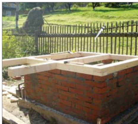
Фиг. 5: Рамка за пода на тоалетната (ляво) и изрязване на отвор за тоалетната чиния (дясно)