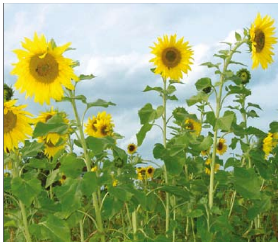
Фиг.2: Повторно използване на екосан продуктите в земеделието или личното стопанство

не привлекают мух. После обработки эти богатые органическими веществами продукты используются в сельском хозяйстве и садоводстве. (см. Рис. 2)