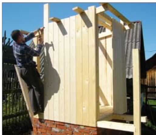
Фиг. 6: Направа на рамката за дървените стени на тоалетната настрана (горе), наковане на стените с дъски - 2 см (долу).