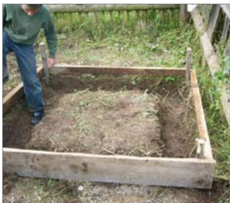
Фиг.3: Бетонен под за фекалните камери - кофраж (горе), завършен под (долу)

Сначала строим форму для фундамента из деревянных плиток. Затем выравниваем верх этих плиток (Верх формы фундамента определяет конечный уровень пола. Затем форма фундамента заполняется бетоном до ее верхней части. Бетон должен сушиться минимум 1-2 дня).