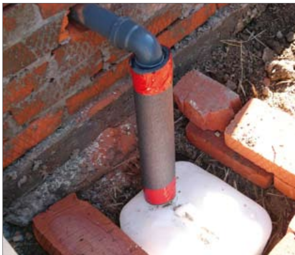
Фиг.10: Фекална камера отвътре с топлоизолиран маркуч за урината - 25 мм, и полипропиленова тръба - 50 мм (ляво). Малък 20 литров контейнер за урина извън тоалетната (дясно)