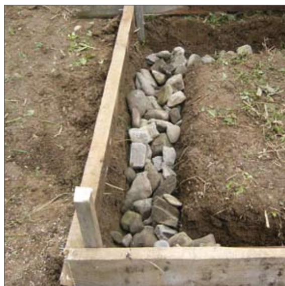
Фиг. 2: Изкопаване на основи (горе) и насипване с камъни (долу)