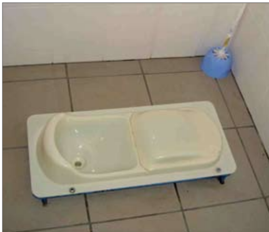
Фиг.1: Разделна тоалетна тип клекало