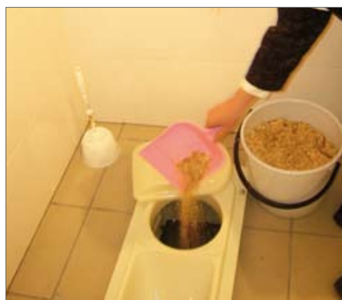
Фиг.8: Разделна тоалетна чиния в читалището на с.Сулица (ляво) и разделна тоалетна - тип клекало (дясно)