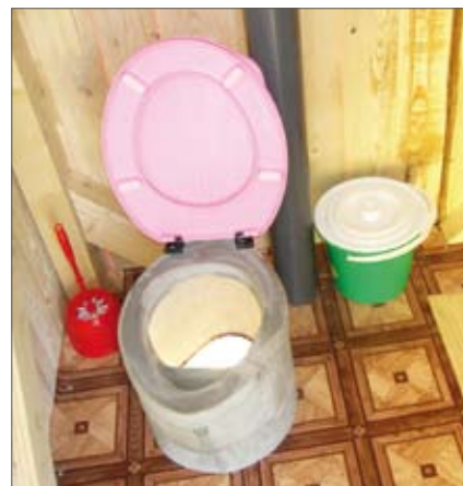
Фиг. 1: Суха разделна тоалетна с две камери: изглед отвън (ляво) и изглед отвътре (дясно).