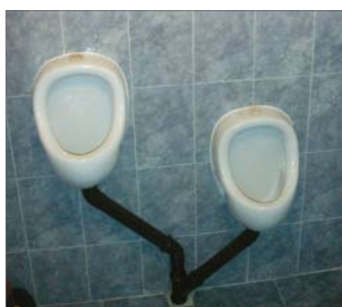
Фиг.9: Писоар без промиване с вода от Южна Африка1 (ляво) и модифициран стандартен фаянсов писоар (дясно) - с.Сулица -читалището