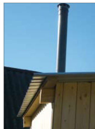
Фиг.7: Наковане на дъски на покрива (ляво) и покриване на покрива с поцинкована ламарина (дясно)